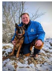
Nils Meier Verkehr u. Camping